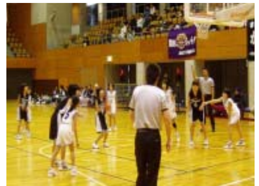
砺波地区戦の様相